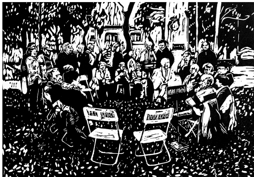
Csaba Nemes, aus der Serie „Testimony of Democracy“, 2018